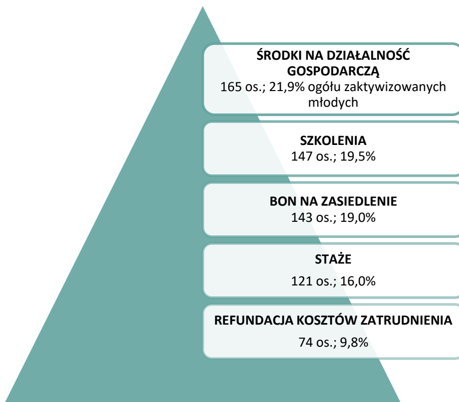
Rysunek 2. Dominujące formy aktywizacji osób młodych do 30 roku życia w IV kwartale 2023 roku (liczba oraz procentowy udział w ogólnej liczbie zaktywizowanych bezrobotnych do 30 r. ż.; 754=100% osób do 30 r.ż. objętych podstawowymi formami aktywizacji)